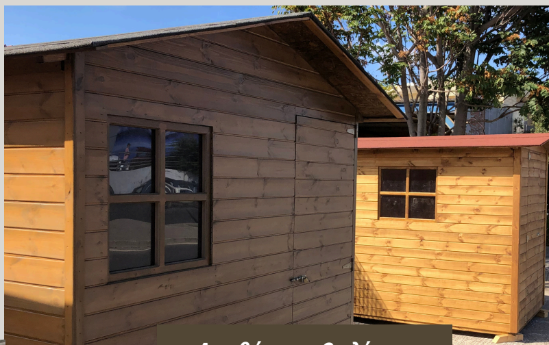
Αποθήκη με 2 κλίσεις

Οι κατασκευές μας κατασκευάζονται σε 5-10 εργάσιμες ημέρες. Κατά τη διάρκεια της κατασκευής, μπορείτε να μας επισκεφτείτε στο κατάστημά μας και να δούμε μαζί αν χρειάζεστε να κάνετε κάποια προσθήκη. Η μεταφορά πραγματοποιείται από έμπειρο συνεργάτη μας και τοποθετείται έτοιμη στο χώρο σας