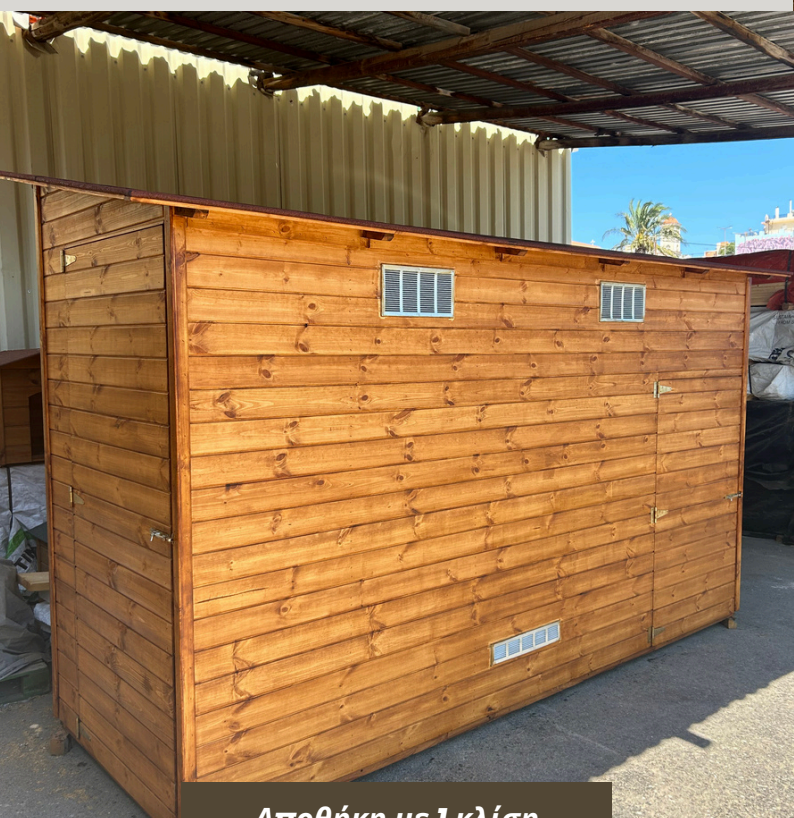
Αποθήκη με 1 κλίση

Οι κατασκευές μας κατασκευάζονται σε 5-10 εργάσιμες ημέρες. Κατά τη διάρκεια της κατασκευής, μπορείτε να μας επισκεφτείτε στο κατάστημά μας και να δούμε μαζί αν χρειάζεστε να κάνετε κάποια προσθήκη. Η μεταφορά πραγματοποιείται από έμπειρο συνεργάτη μας και τοποθετείται έτοιμη στο χώρο σας