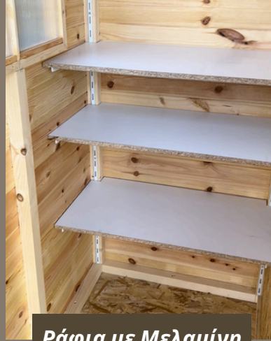
Ράφια με Μελαμίνη