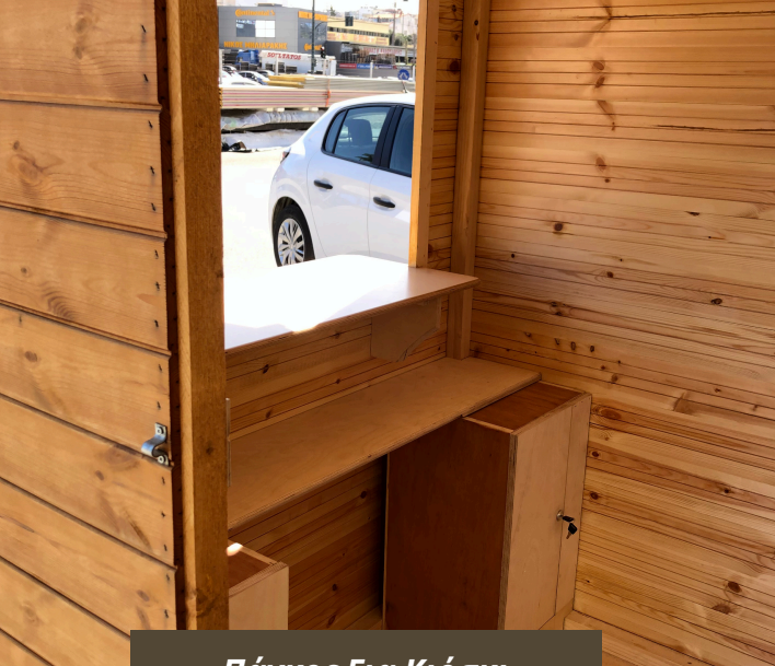
Πάγκος Για Κιόσκι