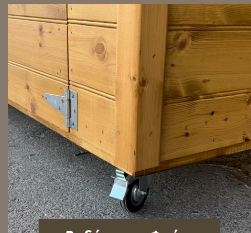
Ροδάκια με Φρένο