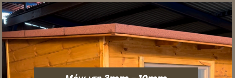
Μόνωση 3mm - 10mm